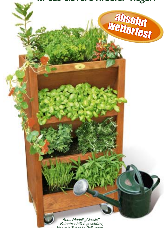
Abb.: Modell „Classic“ Patentrechtlich geschützt, hier mit Zubehör Rollwagen

Ihre liebsten Küchen-Kräuter stets »griffbereit, geschützt und sauber«